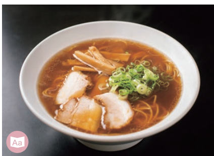
23 RAMEN RAMEN FUJIYA 富士屋