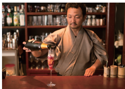
20 BAR CADENZA 華佗座