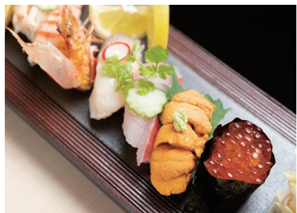
13 SUSHI Kanta no Sushi 貫太のすし