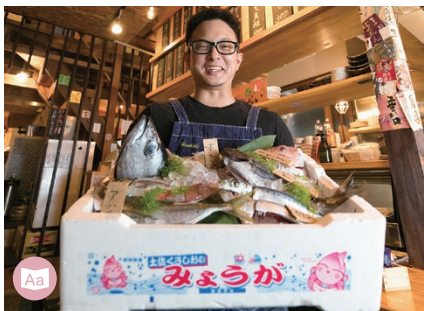
11 IZAKAYA Robotaya Robatan 炉ばた屋 ろばたん