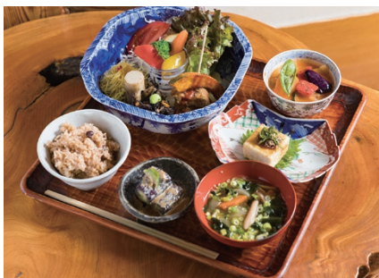
17 RESTAURANT Yasai Shokudo Koyama 野菜食堂 こやま