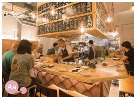
16 IZAKAYA Heiwacho Sakaba Mogura 平和町酒場 もぐら