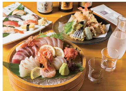
12 IZAKAYA Ryoutei Tamachi Branch Ryoutei 田町店