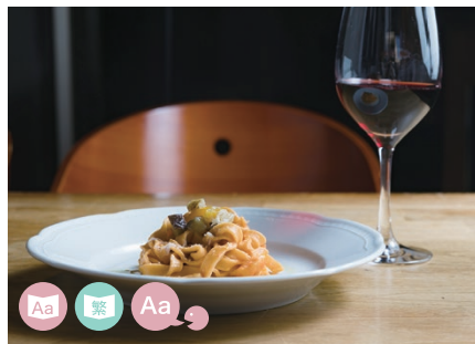
10 RESTAURANT Padang Padang パダンパダン