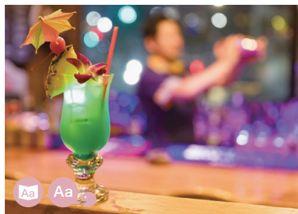
14 BAR Hawaiiianbar MAGIC PAN