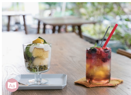
15 CAFE CCCSCD