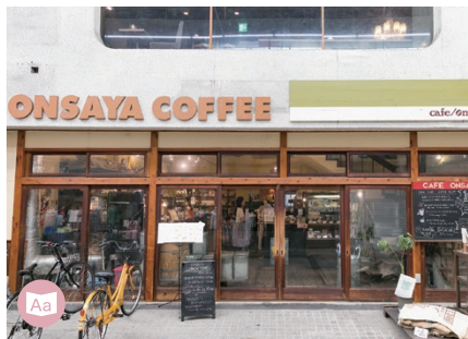
09 CAFE ONSAYA COFFEE Honkan-cho Store ONSAYA COFFEE 幸選町本店