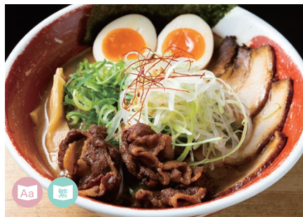
08 RAMEN Men Oh Tokushima Ramen 徳島ラーメン 麵王