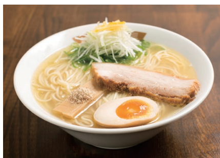
21 RAMEN Menya Gakucho 麵屋 楽々。