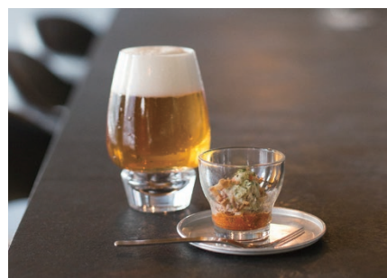
24 CAFE / BAR Lily's Diary