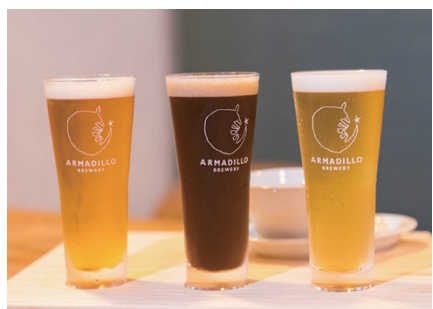
19 BAR Brew Pub ARMADILLO