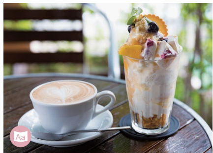
07 CAFE café moni

この情報は2019年6月現在の情報です。内容は変更になる場合があります。 This information is as of June 2019. Content may be subject to change. 截至2019年6月の最新資訊 本地圖為發行時最新資訊,發行後如有變更敬請見諒。