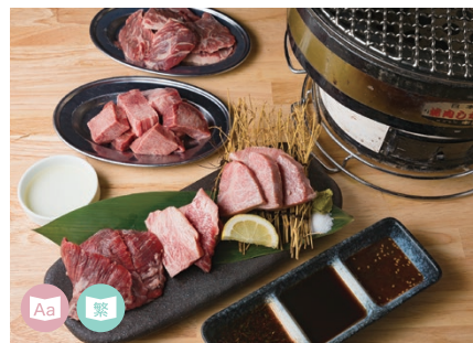
18 GRILLED MEAT Sumibian Hishimekido 炭火焼 丼き堂