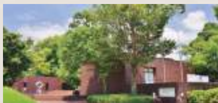
10 本館：「熊本城・市役所前」下車，徒步約15分鐘