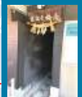
白梅天滿宮 被公寓大廈與民宅圍繞、不可思議的神社