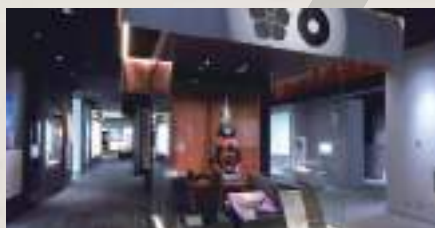
B4 「杉塘」下車，徒步約5分鐘