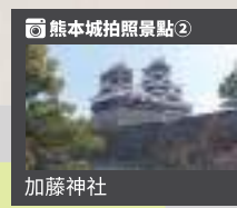
熊本城拍照景點② 加藤神社