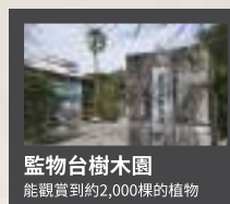
熊本城拍照景點① 監物台樹木園 能觀賞到約2,000棵的植物