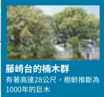
藤崎台の楠木群 有著高達28公尺，樹齡推斷為1000年的巨木