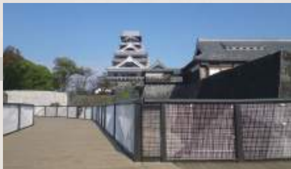
10 「熊本城・市役所前」下車，徒步約15分鐘

大約400年前，花了7年的歲月，由加藤清正這位大名所修築的熊本城。因2016年的地震而受損的天守閣已經修復，不過要從特別參觀通路才能近距離看到現在才能看得見的重建施工進行的狀態。城的周邊有熊本縣立美術館及熊本博物館、熊本縣傳統工藝館，能夠學習到熊本的歷史、文化及傳統工藝品。另外，熊本城城下，有觀光交流設施「櫻之馬場城彩苑」，園區內也有觀光導覽義工常駐的「綜合觀光服務處」。