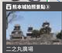
熊本城拍照景點③ 二之丸廣場