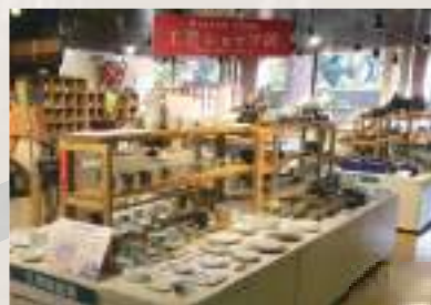
10 「熊本城・市役所前」下車，徒步約7分鐘