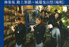
神楽坂 路上昇降～城端曳山祭(聴取)