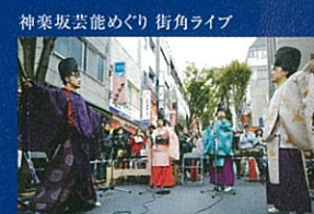
神楽坂芸能めぐり 街角ライブ

主催: アーツカウンシル東京、八王子市、公益財団法人八王子市学園都市文化ふれあい財団 助成・協力: 東京都