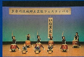
稲城市「いなぎ太鼓」 Inagi-shi "Inagidaiko"