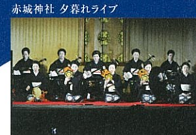
赤城神社 夕暮れライブ