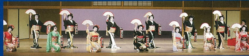
花街のおどり(平成29年度舞台より) | Traditional Geisha Dance