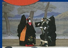
八王子車人形公演(平成29年度の様子)