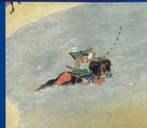
平家物語絵巻より

Co-organized by Tokyo Metropolitan Government, Arts Council Tokyo