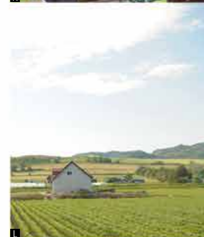
▲ Mikasa Torokko Railway. ■ AEON Super Center Mikasa. ■ Pond smelt fishing in Katsurazawa Lake. ■ Headframe of a former mine. ■ Entrance sign to Mikasa City. ■ Mikasa City Museum. ■ Lavender fields at FARM TOMITA in Furano. ■ Lavender ice cream. ■ View from the Tappuyama viewing platform. ■ The powerful SL train. ■ Asahiyama Zoo. ■ The grand scenery of Furano/Biei. ▲ “三笠矿车铁道”。■ “永旺购物中心三笠店”。■ 在“桂泽湖”垂钓西太公鱼。■ 旧矿山竖井。■ 三笠市入口标牌。■ “三笠市立博物馆”。■ 富良野“富田农场”的薰衣草花田。■ 薰衣草冰淇淋。■ “达布山展望台”上眺望的景致。■ 震撼人心的蒸气火车。■ “旭山动物园”。■ 富良野、美瑛地区可欣赏壮丽景色。 ▲ 三笠 TOROKKO 铁道。■ 永旺超級購物中心三笠店。■ 桂澤湖 釣魚。■ 舊立坑槽。■ 三笠市入口招牌。■ 三笠市立博物館。■ 富良野“富田農場”的薰衣草田。■ 薰衣草霜淇淋。■ 由“達布山展望台”眺望的風景。■ 充滿震撼力的SL火車。■ 旭山動物園。■ 富良野、美瑛地區呈現一片壯闊風景。