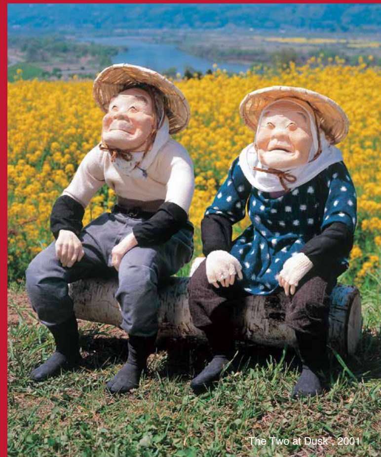
“The Two at Dusk”, 2001