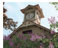
北海道 / 札幌市鐘樓