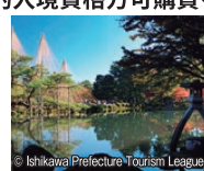
石川縣 / 金澤(兼六園)