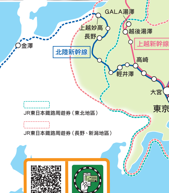
JR東日本鐵路周遊券（東北地區） JR東日本鐵路周遊券（長野、新潟地區）