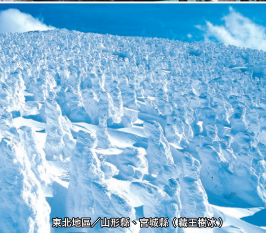
東北地區／山形縣、宮城縣（藏王樹冰）