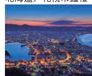
北海道 / 函館夜景