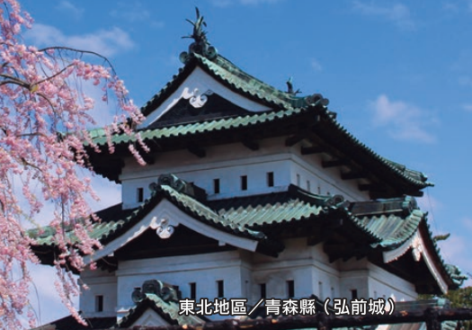
東北地區／青森縣（弘前城）