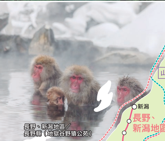
長野、新潟地區／ 長野縣（地獄谷野猿公苑）