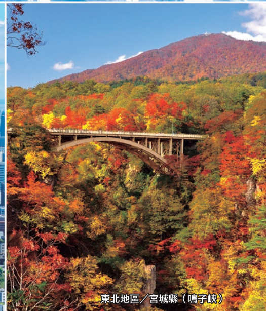
東北地區／宮城縣（鳴子峽）