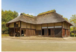
南會津之家 (福島縣)

多層造，養蠶住宅，是豪雪地帶特有的房屋結構，其特點是採用多層建築來彌補山區佔地面積的狹小。