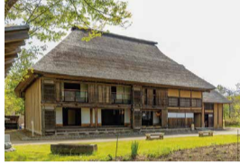
鳴瀨川河畔之家 (宮城縣)

中二樓夾層式養蠶住宅，二樓地板可以拆卸，以抵禦洪水侵襲，曾在此進行大規模養蠶業。