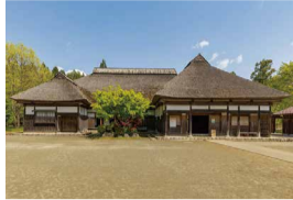
本莊由利之家 (秋田縣)

本地川崎町的民居，在修建釜房水壩時遷建至此。樹齡有600年歷史的湯田河松樹值得一看。