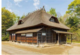
月山山麓之家 (山形縣)

多層造，養蠶住宅，是豪雪地帶特有的房屋結構，其特點是採用多層建築來彌補山區佔地面積的狹小。