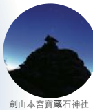
劍山本宮寶藏石神社