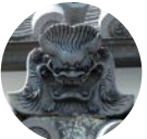
脇町防火道街道兩旁的鬼瓦