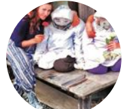
天空之村、稻草人之鄉