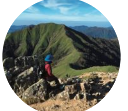
從劍山眺望次郎笈