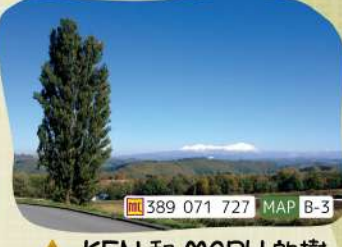
☎ 389 071 727 MAP B-3