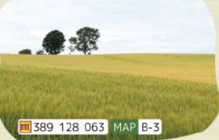
☎ 389 128 063 MAP B-3

兩顆大樹間夾著一顆小樹的樣子，仿如親子間相依偎般，故有親子之樹之稱。 아버지와 어머니 사이에 귀여운 아이가 사이 좋게 나란히 서있는 모습이 마치 가족처럼 보입니다.