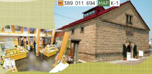
☎ 389 011 694 MAP K-1

「丘之倉」前身為使用美瑛軟石所建造的石造倉庫。裡頭的餐廳提供使用美瑛農產品烹調而成的特色料理外，並販售充滿美瑛風情之特產品。此外，潔淨感滿溢之 Hotel Lavenir 亦附設在旁。 지금부터 70년전에 채굴된 비에이 연석으로 세운 창고를 리모델링한 건물입니다. 비에이의 농산물을 풍부하게 사용한 메뉴가 매력적인 식당과 비에이 선물이가득!! 정결감 넘치는 호텔 라브빌도 병설되어 있습니다. ☎ (0166) 92-0920