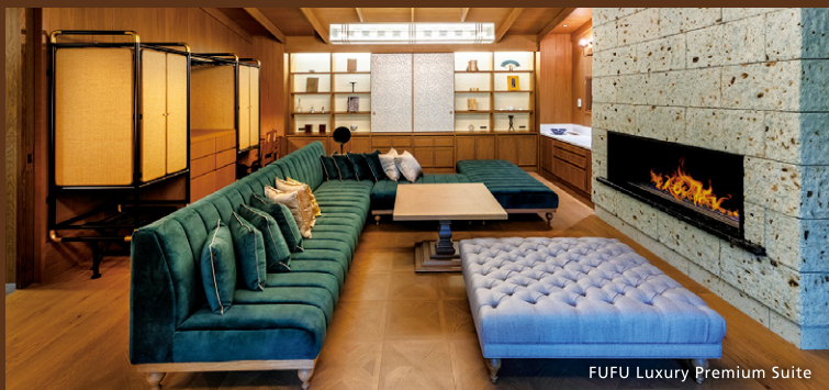
FUFU Luxury Premium Suite

A refined experience where you can unwind amid the elegant scenery of Nikko.