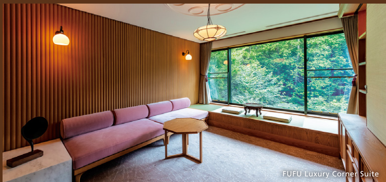
FUFU Luxury Corner Suite