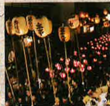
启程仪式前，各组的年轻男子们斗胆在“附小鼓”上一展雄姿。上千盏华丽的纸灯笼照亮夜空，引导着高台鼓队前行。