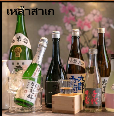
เหล้าสาเก