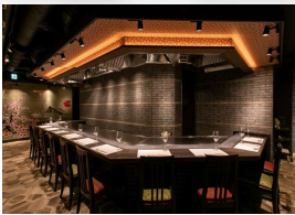
Kobe Beef Steak SAKURA

แนะนำ 3 ร้านดังที่ใช้เนื้อโกเบคุณภาพชั้นนำระดับโลก ร้านดัง 3 แห่งที่ chill chill japan ภูมิใจเสนอ!