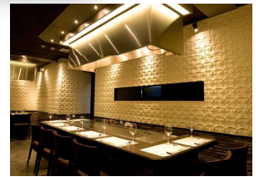
Kobe Steak SAI-DINING

โปรดตรวจสอบเว็บไซต์สำหรับข้อมูล ร้านค้าและการจองทางอินเทอร์เน็ต