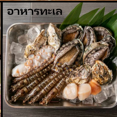
อาหารทะเล

แนะนำ 3 ร้านดังที่ใช้เนื้อโกเบคุณภาพชั้นนำระดับโลก ร้านดัง 3 แห่งที่ chill chill japan ภูมิใจเสนอ!