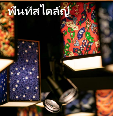
พื้นที่สไตล์ญี่ปุ่น